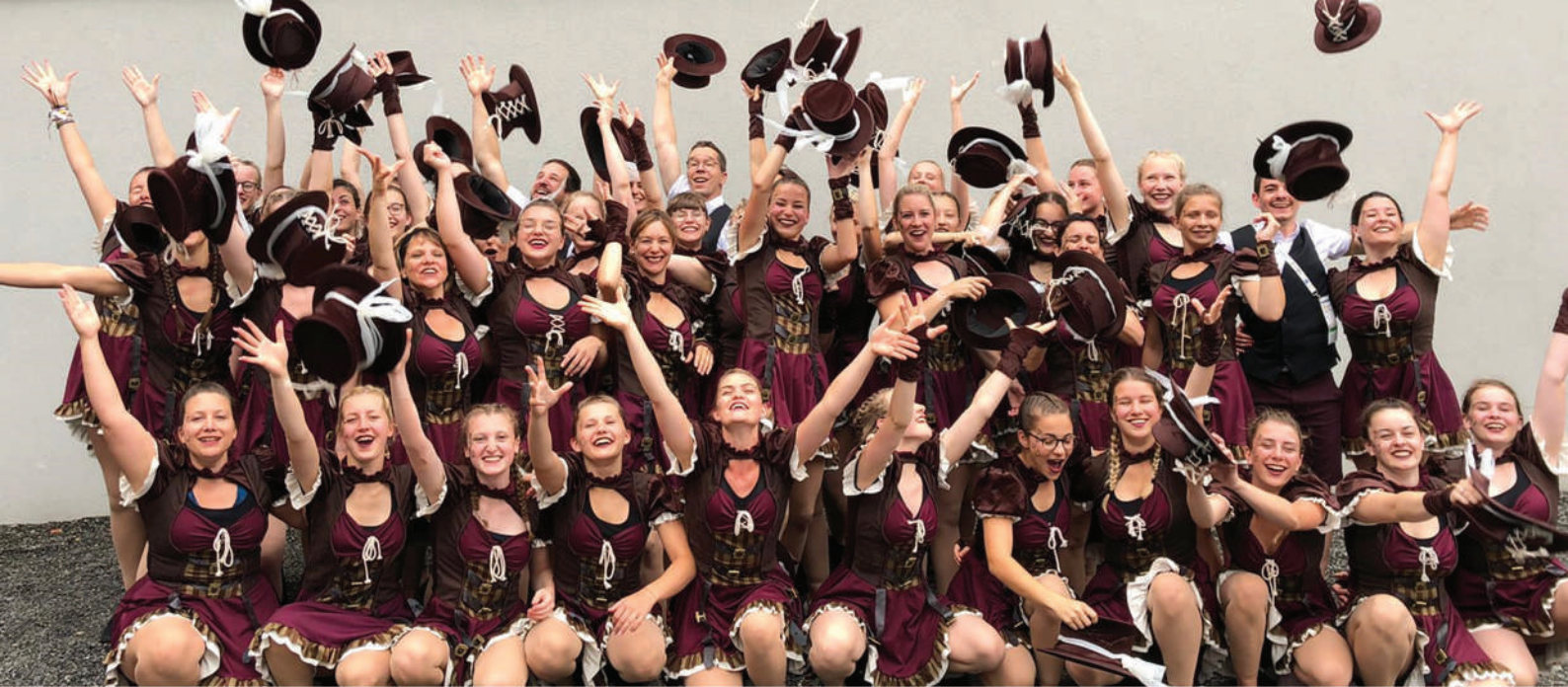
Gymnastrada 2019 - Dornbirn