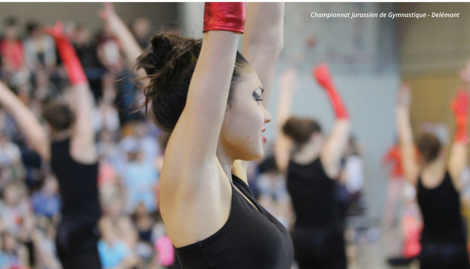
Championnat Jurassien de Gymnastique - Delémont