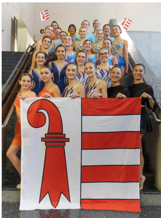
Les gymnastes jurassiennes sélectionnées pour la finale des Championnats suisses

Les nombreux drapeaux jurassiens dans le public ont pu s'agiter pour les gymnastes jurassiennes de Fémina Vicques, Créa'Move Delémont, Fémina-Club Develier, Sport-Gym Courtételle et FSG Courroux-Courcelon qui n'ont pas démerité en présentant de magnifiques programmes avec de très bonnes notes. Et, ne l'oublions pas, il est déjà exceptionnel de décrocher une qualification pour cette finale et de figurer parmi les huit meilleures du pays !