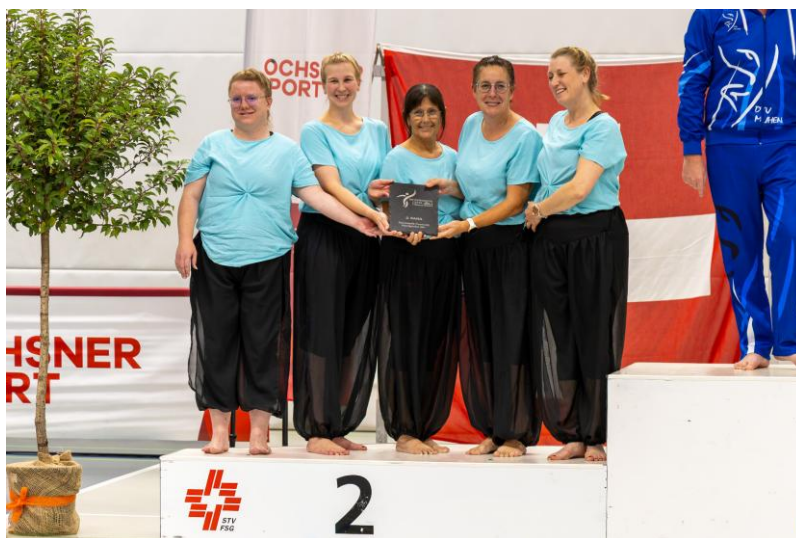
La Team 30+ de Sport-Gym Courtételle - vice championne suisse

Toutes nos félicitations à ces 5 gymnastes et bravo pour cette belle prestation !