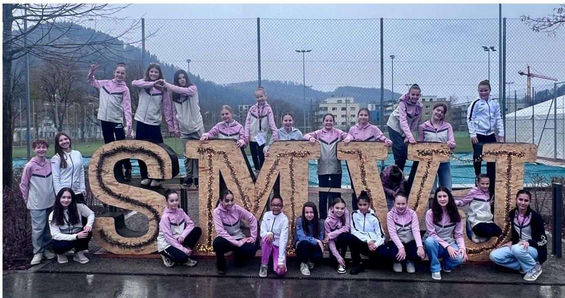
Les gymnastes de la FSG Courroux-Courcelon

La FSG Courroux-Courcelon a pris part à cette compétition d'un niveau très élevé avec un groupe Minis et un groupe Cracks, 27 gymnastes au total. Elles n'ont malheureusement pas obtenu de podium, mais elles garderont des souvenirs plein la tête de ces deux magnifiques journées de gymnastique.