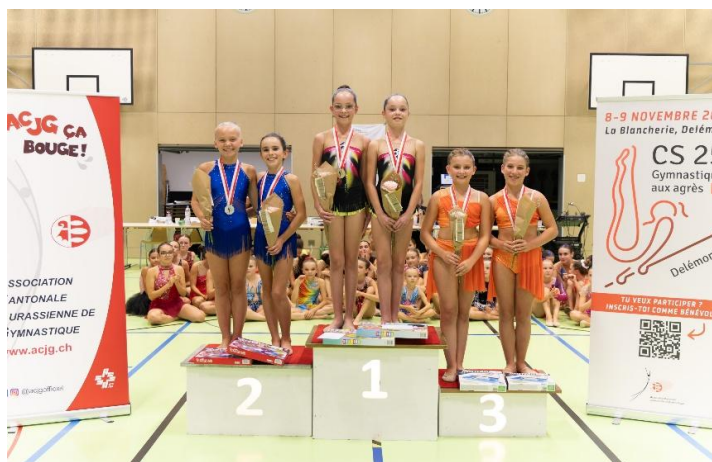
Podium Jeunesse 1 / gym à deux avec engin à main